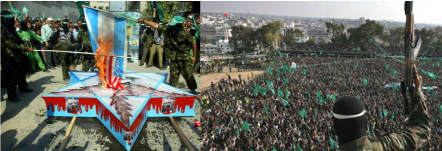
Zehntausende Anhänger auf Hamas-Kundgebung

Am 25. Juli 2000 endeten mit „Camp David II“ die Gespräche zwischen dem US-Präsidenten Bill Clinton, PLO-Chef Jassir Arafat und dem israelischen Ministerpräsidenten Ehud Barak. Arafat wollte sich mit 96 % von Gazastreifen und Westbank, einer unabhängigen Verbindungsstraße und Millionenbeträgen zum Staatsaufbau nicht zufrieden geben und verhinderte somit einen unabhängigen palästinensischen Staat. Er kehrte nach Ramallah zurück und rief die Zweite Intifada aus. Der Besuch des israelischen Politikers Ariel Scharon am 28. September 2000 auf dem Tempelberg in der Jerusalemer Altstadt, wurde von palästinensischer Seite erst im Nachhinein als Grund für den antisemitischen Gewaltausbruch angegeben. Der palästinensische Sicherheitschef Dschibril Radschub gab für den angekündigten Besuch vorher sein Einverständnis. [20] Fakt ist, dass der „Aufstand der Palästinenser“ schon vorher geplant wurde. So gab es auch schon vor Scharons Besuch antiisraelische Anschläge. Arafat wusste vermutlich schon am Verhandlungstisch in Camp David, was in der nächsten Zeit passieren wird. Er war schon immer ein Meister im Täuschen der Öffentlichkeit. [21] Die Zweite Intifada sollte die palästinensischen Terrorgruppen zusammen schweißen, die Oberhand hatte dabei die Hamas. Wäh-