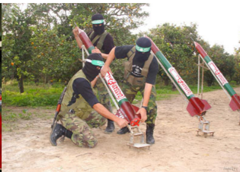
Vorbereitungen für Raketenangriffe auf Israel

ganzen westlichen und arabischen Welt herbeizuführen. Die Eroberung Palästinas muss hierfür der erste Schritt sein. [26]